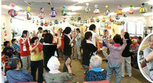
利用者さまも浴衣を着て職員と一緒に盆踊りを楽しみました。(CFしまなみ)

今年もベストケア恒例の夏祭りが各地で開催されました。 楽しいひと時のスナップを、ぜひご覧下さい。