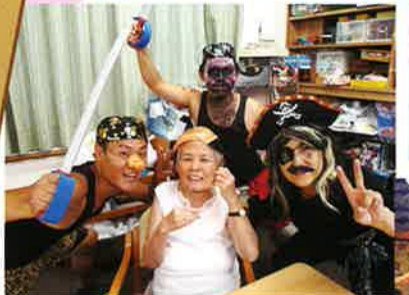
謎の海賊団登場! 利用者様と一緒に「パイレーツ野球拳」を楽しみました。(D山越)