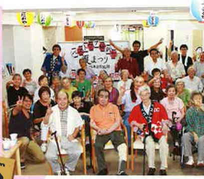
全員集合! 楽しい夏祭りもまた来年(D桜新町)