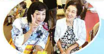
↑ショート来住所長とニコリ ↓折り紙で作ったカエルを釣り 上げました。(D&S来住)